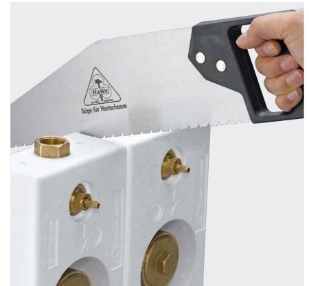
Trennung des Montageblocks (zum Singleblock) mit handelsüblicher Säge