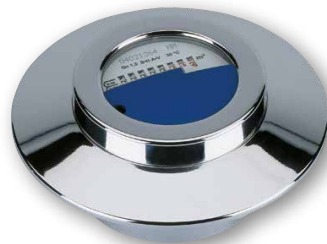
UP-Kompaktzähler für modulares Funkssystem (ECO)