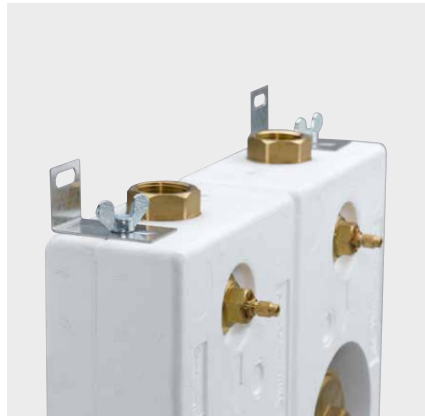
Befestigungsdarstellung inkl. Montagewinkel