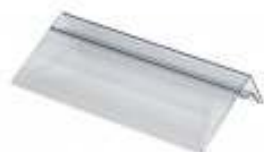
Blisterhalter für Schlauchblister

Blisterhalter, Etikettenhalter und komplette Startersets runden das Programm ab