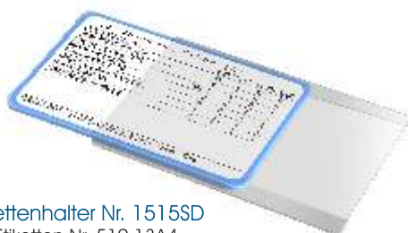
Etikettenhalter Nr. 1515SD mit Etiketten Nr. 510.13A4