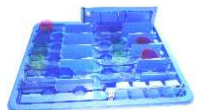
Startersets: stellen Sie sich die Sets selber zusammen