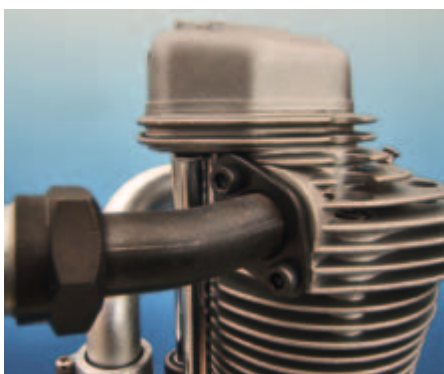
Der Krümmer wird mittels Flansch gehalten.

nehmen, bevor dort die Flamme rauskommt.