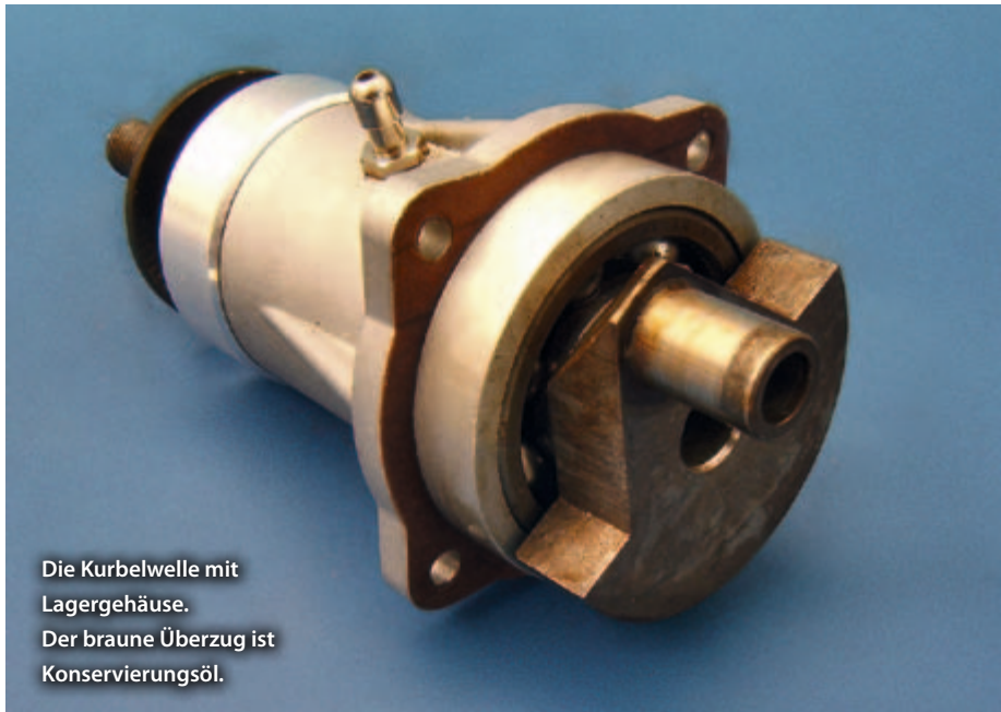
Die Kurbelwelle mit Lagergehäuse. Der braune Überzug ist Konservierungsöl.

irgendwann ist bei denen auch Schluss. In der Praxis sollte man am Boden 10.000 1/min nicht überschreiten, dann hat man noch einiges an Reserven für den Bahnneigungsflug, denn, abhängig von der Propellersteigung, legt der Motor da noch mal ordentlich an Drehzahl zu. Das Leistungsmaximum liegt bei etwa 10.500 1/min, schon deshalb machen höhere Drehzahlen wenig Sinn, es sei denn, man steht auf den Sound.