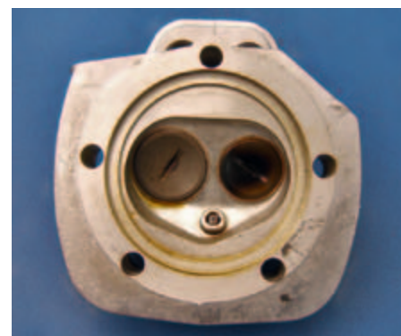
Blick in den Brennraum, das größere Ventil ist der Einlass.

Der beiliegende Schalldämpfer sorgt für eine nicht zu laute, aber gut vernehmbare Geräuschkulisse. Der Hersteller gibt den zulässigen Drehzahlbereich bis 12.500 1/min an, die Grenzdrehzahl für den Ventiltrieb soll bei 13.000 1/min liegen. Ich hab's ausprobiert, das Triebwerk packt das tatsächlich, aber praktikabel ist das nicht. Zum einen erreicht man die 12.000 1/min nur mit Luftschrauben unter 13 Zoll, was dem Antriebswirkungsgrad nicht gerade dienlich ist, und zum anderen hat man bei einer 13-Zoll-Luftschraube eine Blattspitzengeschwindigkeit von 207 m/s, zulässig für APC-Propeller dieser Größe sind etwa 180 m/s. Das ist gefährlich, außerdem wird's bei 2/3 der Schallgeschwindigkeit schon richtig laut. Bei noch mehr Drehzahl geraten die Ventile in eine Resonanzschwingung, sie fangen an zu schwirren, geraten also in einen nicht mehr definierten Zustand. Den Ventilen, Federn, Stößelstangen und Kipphebeln ist das egal, aber die Kegelhälften, die die Ventile halten, werden dann nicht mehr richtig eingespannt und können im schlimmsten Fall herausfliegen, dann fällt das Ventil in den Zylinder und das ist nicht gut. Wenn das bei 12.000 1/min passiert, ist das Triebwerk definitiv Schrott. In den Griff bekäme man das mit progressiv statt linear gewickelten Ventilfedern, aber