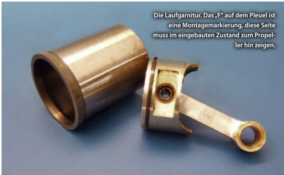
Die Laufgarnitur. Das „F“ auf dem Pleuel ist eine Montagemarkierung, diese Seite muss im eingebauten Zustand zum Propeller hin zeigen.