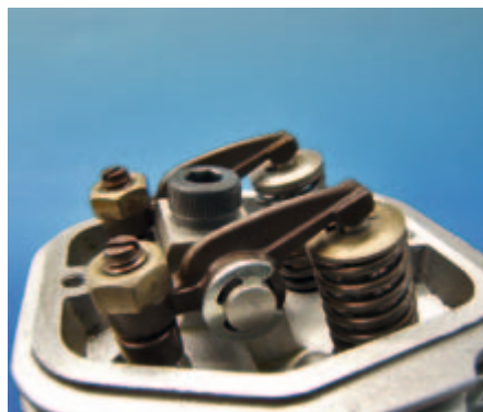
Kipphebel mit Einstellschrauben

Das Triebwerk zeigte eine kernige Leistungsentfaltung, die Leerlaufdrehzahl war stabil bei etwa 2.000 1/min und die Gasannahme spontan. Das ganze wird durch einen fast schon aggressiven Sound untermalt. Im Testbetrieb zeigte sich, dass der Enya Nitroanteile unter 5% nicht mag, er läuft damit zwar immer noch zuverlässig, aber recht hart. Mit den von mir eingesetzten 10% erhält man eine wesentlich weichere Verbrennung, deutlich mehr Laufkultur und etwas mehr Leistung.