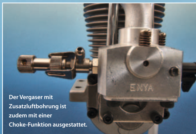
Der Vergaser mit Zusatzluftbohrung ist zudem mit einer Choke-Funktion ausgestattet.

Wie immer habe ich den Motor, wie er aus der Schachtel kam, mit dem Serienschalldämpfer ausgestattet, an die Messwelle montiert und zunächst gut eine Stunde bei wechselnden Drehzahlen laufen lassen. Das Triebwerk sprang auf Anhieb sehr gut an, der Choke funktioniert perfekt und das in der Anleitung beschriebene Startprozedere führte direkt zum Erfolg. Allerdings ist Vorsicht geboten, wenn man das Triebwerk von Hand, also ohne E-Starter anwirft. Wie alle leistungsorientierten Methanolviertakter mit relativ hoher Verdichtung neigt der Enya zu Frühzündungen. Dreht man zu zaghaft am Propeller, schafft man es