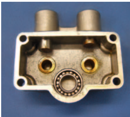
Das Nockenwellengehäuse mit Lagerbuchsen, Kugellager und Stößeln

nicht, ihn über den OT zu werfen und dann gibt's auf die Finger – mit der Kolbenfläche einer 34er Bohrung und ordentlich Druck dahinter, merkt man das deutlich. Es haut den Finger zwar nicht ab, schafft aber ein Erlebnis, an das man sich eine Weile erinnert – auch mit Handschuh. Deshalb habe ich für alle weiteren Starts einen Elektro-Starter verwendet, dann geht's noch einfacher. Glühung dran, Starter drauf, kurz den Auspuff zuhalten, läuft. Die Kunst dabei ist, den Finger vom Auspuff zu