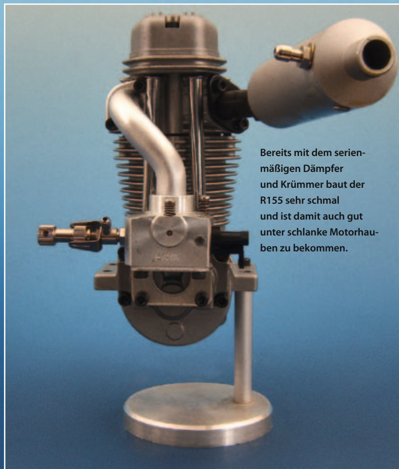
Bereits mit dem serienmäßigen Dämpfer und Krümmer baut der R155 sehr schmal und ist damit auch gut unter schlanke Motorhau- ben zu bekommen.