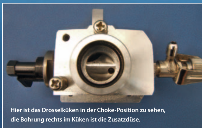
Hier ist das Drosselkükens in der Choke-Position zu sehen, die Bohrung rechts im Kükens ist die Zusatzdüse.