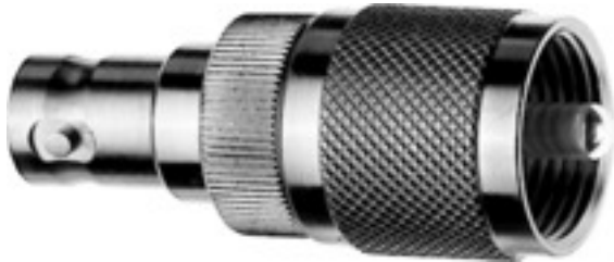
Abb. kann abweichen