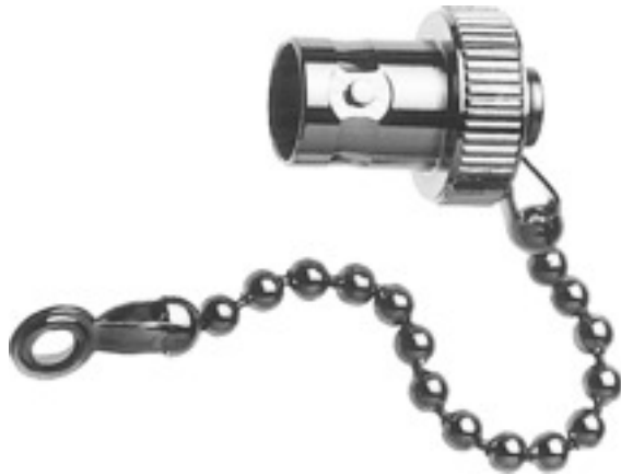
Abb. kann abweichen