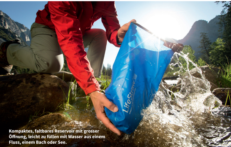
Kompaktes, faltbares Reservoir mit grosser Öffnung, leicht zu füllen mit Wasser aus einem Fluss, einem Bach oder See.