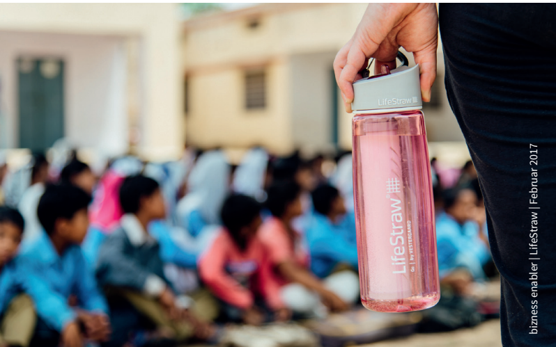
Nachfüllbare Wasserflasche mit eingebauter LifeStraw Filtertechnologie für Outdoor-Aktivitäten und Reisen

business enabler | LifeStraw | Februar 2017