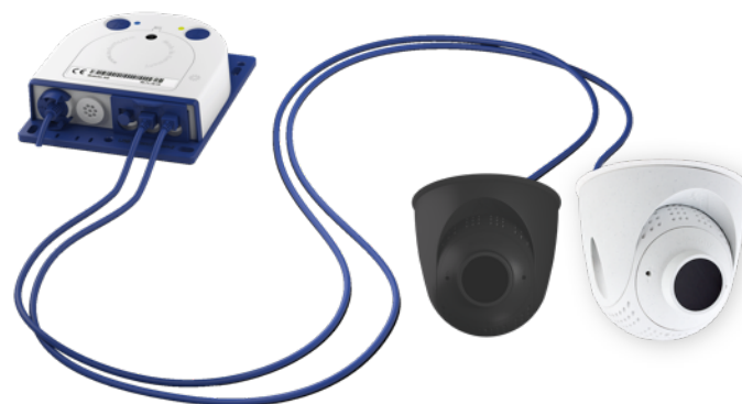
S16 mit zwei PTMount-Thermal