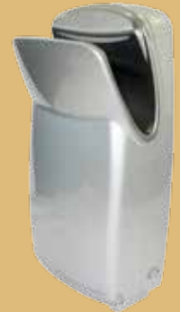
silber / silver