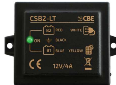
CSB2-LT p/n 205026