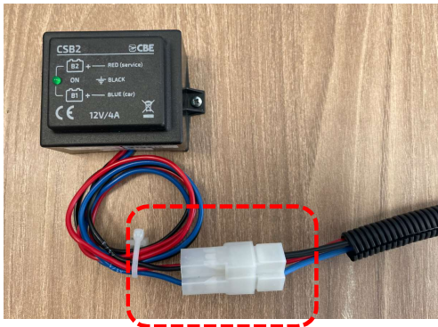
CSB2 p/n 205025