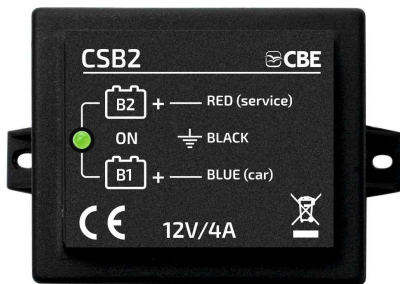
CSB2 p/n 205025