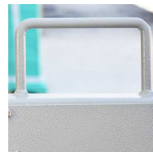
Asa de fácil transporte