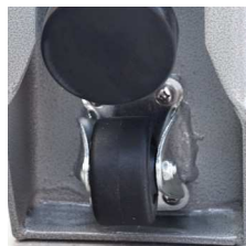
Ruedas de transporte