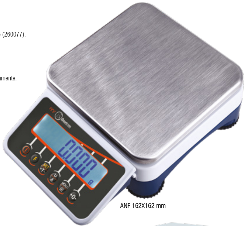
ANF 162X162 mm