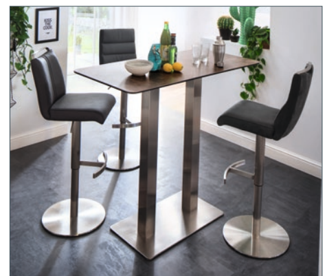
Barstuhl GIULLIA mit Tisch ZARINA 3