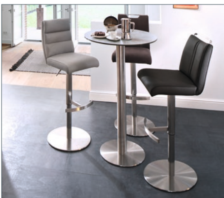
Barstuhl GIULLIA mit Tisch ZARINA 1

Barstuhl mit Griffloch Gestell: Edelstahl gebürstet rund Standteller: Ø 42 cm, Edelstahl gebürstet ummantelt 360° drehbar, höhenverstellbar, Gasdruckfeder B - H - T: ca. 39 - 88-113 - 50 cm • VPE: 1