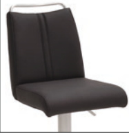
Ausführung A mit Griffleiste