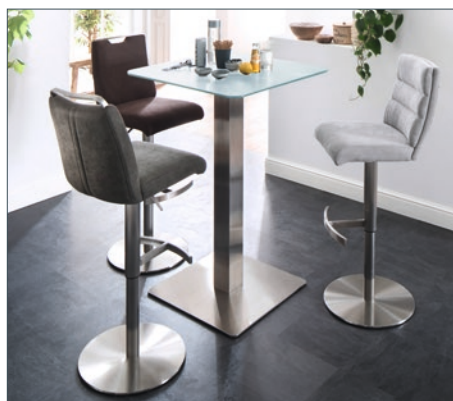
Barstuhl GIULLIA mit Tisch ZARINA 2