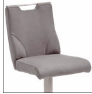
Ausführung C mit Griffloch