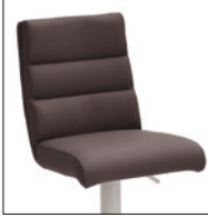
Ausführung B mit Griff hinten