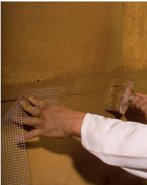
Abbildung 5.3.3: Einarbeiten von Flächen- oder Fugenarmierung (hier Glasgewebe-Fugenarmierung)