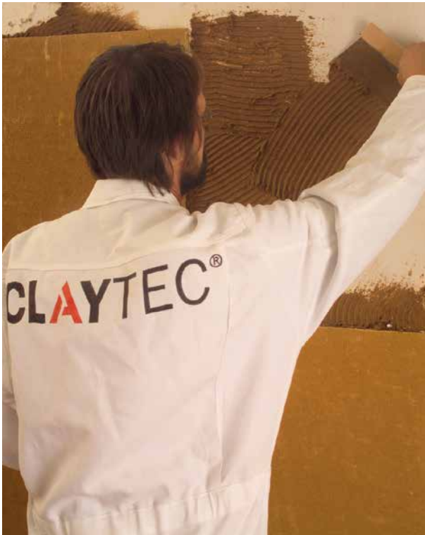
Abbildung 5.3.1: Aufziehen von Lehmkleber mit dem Zahnschachtel auf die vorbereitete Fläche