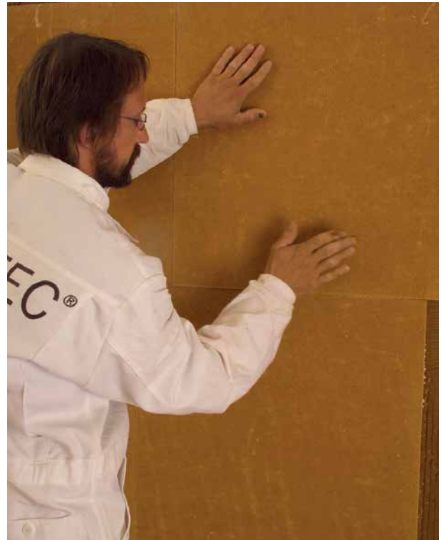
Abbildung 5.3.2: Ansetzen der Lehm-Trockenputzplatten D16 unmittelbar nach Aufziehen des Klebers