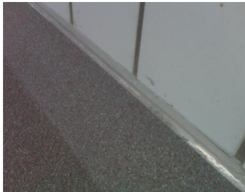
Fertige Hohlkehle mit Profil