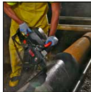
Sicherer für Schnitt von duktilen Gussrohren