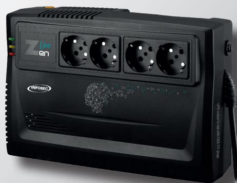
Zen Live 800 / 1000 VA