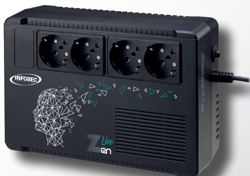
Zen Live 500 / 650 VA